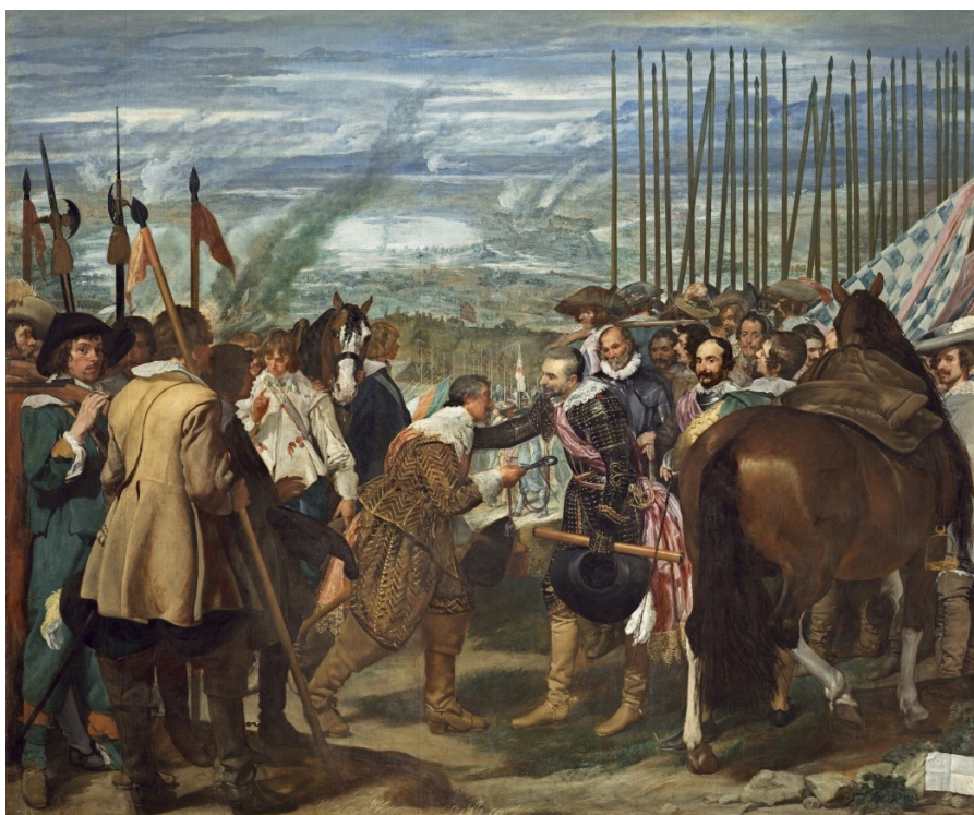
La rendición de Breda o Las lanzas de Diego Velázquez, ejemplo paradigmático de la “historia de las grandes batallas” extrapolada a la Historia del Arte con la representación de la victoria española en el sitio de Breda

Limitar la historia militar a las guerras es un error que excluye muchos objetos de estudio que esta disciplina puede abordar, siendo un gran ejemplo de esto la historia militar de los tiempos de paz (Frieyro de Lara, 2015). Efectivamente, emplear solo un enfoque como el ya referido privaría a los académicos de poder examinar el papel de lo militar durante periodos sin guerra por entender que trabajos de esta naturaleza no despertarían interés alguno (Hernández Sánchez-Barba & Alonso Baquer, 1987). Consideraciones de este tipo relegarían lo militar a ser una temática prácticamente tabú en ámbitos investigadores, y reduciendo el número de investigadores en la materia. En España, por ejemplo, los trabajos científicos dedicados al ámbito militar serían realizados durante mucho tiempo por extranjeros (Fernández Bastarreche, 2002).