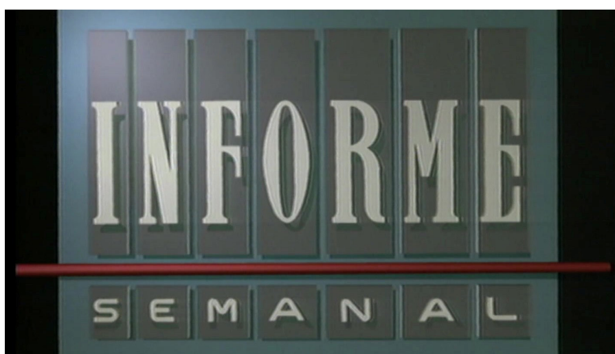
Primer rótulo de Informe Semanal

La forma de transmitir información y desinformación hoy en día es amplia. Desde los clásicos programas informativos y de tertulia hasta algo tan novedoso como las redes sociales, donde el contenido puede ser expuesto en vídeos, directos y, más llamativo todavía, los memes. Sin embargo, el estudio que aquí se presenta no estará centrado en estas expresiones más modernas, sino en un programa en concreto fácilmente reconocible para los españoles y en un tema de importancia capital en la historia española del s. XX. El programa no es otro que el archiconocido Informe Semanal , y la temática es lo militar. Informe Semanal es un programa informativo de emisión semanal de Radiotelevisión Española en los canales La 1 y Canal 24 horas, siendo considerado un programa decano de la televisión española al ser superado en tiempo de emisión solo por el Telediario (2). Su contenido consiste en una serie de reportajes de 10-20 minutos en aproximadamente una hora de programa que, debido a encontrarse en la televisión pública, son realizados en un lenguaje perfectamente accesible que permite comprender el lenguaje ideológico que imperaba en el momento en que fueron realizados. Explicar la relación entre España y lo militar requerirá algo más de tiempo.