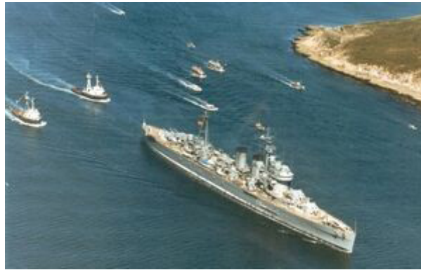
El Canarias camino del desguace https://www.losbarcosdeeeugenio.com/barcos/es/es/ae_C21.html#gsc.tab=0

Comenzando por el final, independientemente de las sensibilidades políticas de cada cual parece obvio que el crucero Canarias merece de sobra un reportaje de Informe Semanal. Sirviendo como una herramienta del bando sublevado durante la Guerra Civil es un hecho que su desempeño en combate y el número de operaciones en las que fue empleado, junto a su utilidad en tiempos de paz y al hecho de ser el último buque de la clase Washington en ser retirado, el crucero Canarias fue un símbolo de un acontecimiento que marcaría el devenir histórico y político de España durante el siglo XX. Por todo ello resulta lógico que con motivo de su última singladura se dedicase un espacio en la televisión pública para rememorar brevemente su trayectoria.