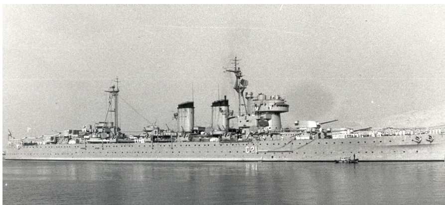
El crucero pesado Canarias en el puerto de Almería