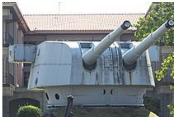
Segunda torreta de proa con dos cañones de 203 mm. conservada https://es.wikipedia.org/wiki/Canarias_(C-21)#/media/Archivo:Segunda_torreta_de_proa_del_crucero_pesado_Canarias_(desguazado_en_1977)_con_dos_ca%C3%B1ones_de_203_mm_(14716849852).jpg

Para responder a la cuestión sobre la relación entre lo militar y la televisión pública es preciso volver un poco hacia atrás. Recordando que el reportaje fue emitido mientras que España continuaba siendo una dictadura de corte militar en que el gobierno tenía pleno control de la televisión pública no resulta extraño cómo fue hecho dicho reportaje. El tono grandilocuente evocando las glorias del pasado, la exaltación de las victorias que consiguió y la utilización de música clásica para que el público se vea inmerso de forma inconsciente en estas acciones muestran que, en esencia, la televisión pública tenía como misión adoctrinar al público a través de la remembranza de glorias pasadas utilizando como vehículo una herramienta capital en el triunfo franquista sobre los republicanos.