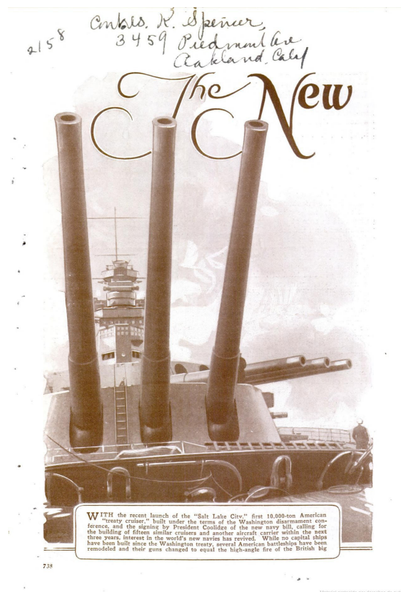
Portada del capítulo "New navies" de la revista estadounidense "Popular Mechanics" donde se muestran las limitaciones de los cruceros de guerra tras el Tratado Naval de Washington de 1922

Grecia. En diciembre de 1963 sería parte de una nueva búsqueda junto a dos fragatas, infructuosa en este caso, del mercante Castillo de Montjuic, desaparecido en el transcurso de la travesía entre Boston y La Coruña. Estuvo presente en las Semanas Navales de Barcelona, en 1966, y Santander, en 1968 (Aguilera & Elías, 1980). En 1969 prestó servicio en la campaña de Guinea Ecuatorial con la misión de evacuar tanto contingentes españoles como población civil tras la independencia de este territorio el año anterior. En 1971 aparecería de nuevo en la Semana Naval de Alborán, visitando los puertos de Melilla y Almería (Aguilera & Elías, 1980).